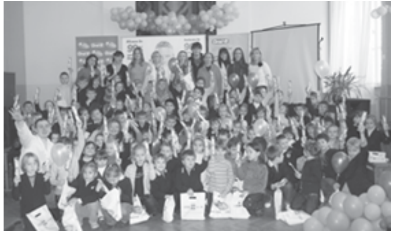
Дітям дуже подобаються веселі та цікаві "Уроки здоров'я"