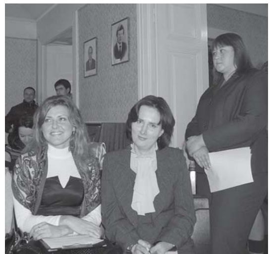
Успіху Першої наукової конференції лікарів-інтернів раділи і її організатори (фото зліва), і її учасники (фото справа)