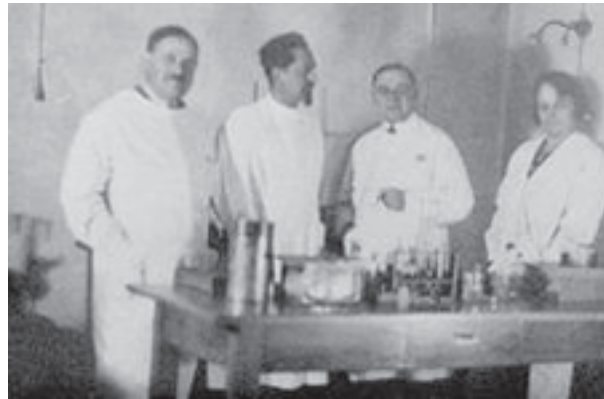
Рудольф Вейгль (крайній справа) з представниками Міжнародного товариства рикетсіологів, серед яких лауреат Нобелівської премії Чарльз Ніколь (фото вгорі).

У 20-30-х рр. ХХ ст. кафедра загальної біології Львівського університету стала всесвітньо відомою. Її часто відвідували представники Міжнародного товариства рикетсіологів, включаючи лауреата Нобелівської премії Чарльза Ні-