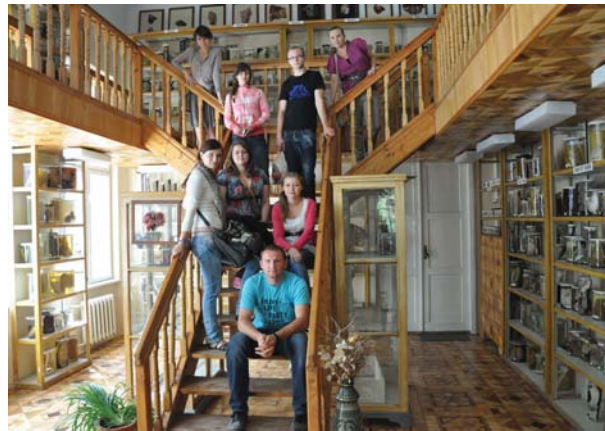
Польські практиканти в Музеї хвороб людини (ліворуч); відзнака Медичного університету в Любліні

У 2007 році ректори Львівського національного медичного університету імені Данила Галицького та Медичного університету в Любліні ухвалили програму з проведення літньої практики студентів-стоматологів обох навчальних закладів. У 2010 році в Любліні відбулося підписання на новий термін Угоди про співпрацю між Львівським національним медичним університетом імені Данила Галицького (ректор – академік Борис Зіменковський) та Медичним університетом у Любліні (ректор – професор Анжей Ксьонжек).