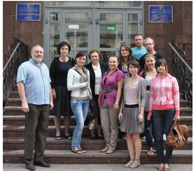
Студенти з Любліні разом з кураторами біля Стоматологічного центру ЛНМУ

П'ять років триває співпраця між стоматологічними факультетами Львівського національного медичного університету імені Данила Галицького та Медичного університету в Любліні (Польща). За цей час 80 студентів-стоматологів з Польщі та України змогли поглибити свої знання, освоїти нові методики практичної стоматології, ознайомитися з системами надання стоматологічної допомоги сусідніх країн, отримати цікаву інформацію.