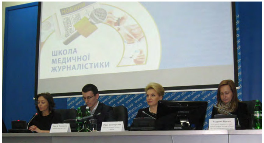
З вітальним словом до учасників другого модуля "Школи медичної журналістики" звернулася міністр охорони здоров'я України Раїса Василівна Богатирьова

"ВАКЦИНАЦІЯ: ТІЛЬКИ ФАКТИ" – під такою назвою 21 - 22 березня 2013 року у Києві в Українському національному інформаційному агентстві "УКРІНФОРМ" пройшов другий модуль "Школи медичної журналістики". Цей захід був організований за ініціативи Національної спілки журналістів України та за підтримки Міністерства охорони здоров'я. Партнерами проекту виступили Міжнародна громадська організація "Клуб лікарів і фармацевтів", Консорціум "Менеджмент Консалтинг Груп" та компанія "ГлаксоСмітКляйн Фармасьютикалс Україна".