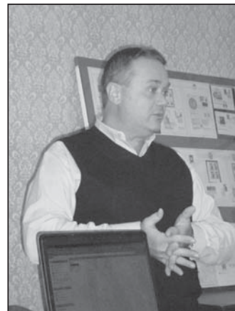
Професор Валерій Бебик – гість Лікарського клубу імені Юрія Липи.

Валерій Бебик відомий як автор популярної програми «З глибини тисячоліть», яка виходить щонеділі на Першому каналі Національного радіо і користується великою популярністю. Її було визнано Галицькою «Просвітою» м. Львова кращою радіопрограмою 2011 року. Крім того, у Валерія Михайловича є своя авторська сторінка в рубриці «Історія краю» на шпальтах парламентської газети «Голос України». Крім того, на каналі «Тоніс» щосуботи та щонеділі можна дивитися програму Валерія Бебика «Цивілізація INCOGNITA», яку цьогогоріч було відзначено Золотою медаллю «Незалежність» Київської організації Національної спілки журналістів. Під час зустрічі з львівською медичною громадою професор В.Бебик розповів про свої найновіші історико-цивілізаційні розвідки в